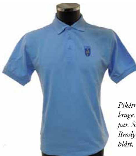
Pikétröja med ribbstickade muddar och krage. Knappslå med färgmatchande knappar. Sidsprund. 100% bomull 230g/m 2 . Brodyr på bröst och ärm. Finns i marinblått, ljusblått och vitt. Pris 199 kr.

Årets Sambands- och IT-konferens för oss FRO:are, där vi möts och diskuterar teknik och intressanta tekniska lösningar, genomförs helgen den 6-8 november på hotell Stinsen i Hallsberg. Syftet med konferensen är att gemensamt utveckla FRO inför framtiden. Det gäller både tekniska system och den service vi framgent ska ge. Dessutom ska alla deltagare känna att de bidraget och själva utvecklats som FRO:are. Vi planerar genomföra programmet genom dels presentationer som innehåller både enklare introduktion, som fördjupningar som leder oss vidare i utvecklingen. Några sessioner kommer att genomföras som diskussionspaneler. Möjligheter till informella ämnen och möten kommer att finnas. Mer information finns på fro.se . Anmälan sker i Utbildningskatalogen senast 2 oktober.