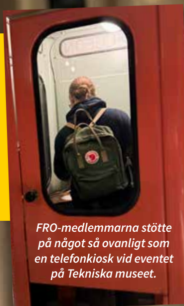
FRO-medlemmarna stötte på något så ovanligt som en telefonkiosk vid eventet på Tekniska museet.