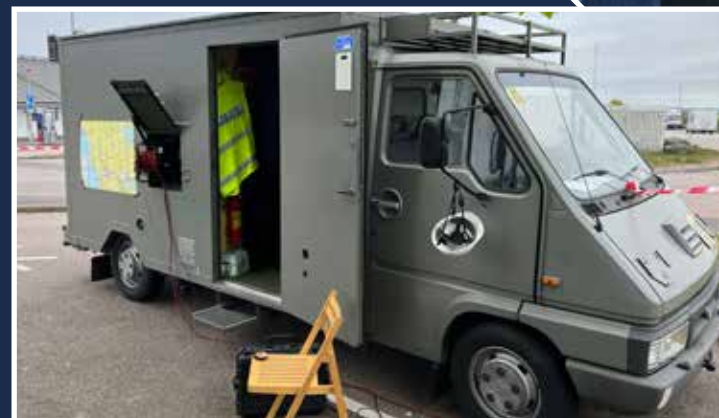
FRO Skånes eget sambandsfordon som användes under Majsnö.