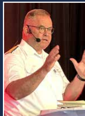
Ministern för civilt försvar, Carl-Oskar Bohlin, fick i Visby hamn möjlighet att på nära håll studera Molos utrustning, en del av den materiel som kan bli avgörande för Sveriges beredskap. Till höger: panelsamtalet "Håll gränsen – vilket försvar behöver Sverige i en ny världsordning?" där ÖB Michael Claesson diskuterade militär upprustning, gränsförsvar och vikten av internationell samverkan.