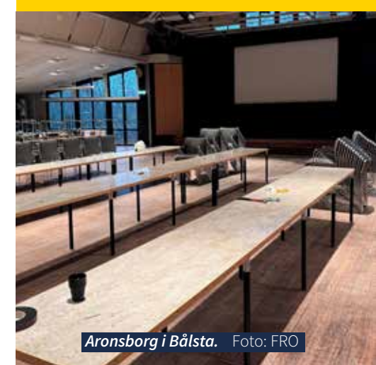
Aronsborg i Bålsta.

De kunde konstatera att Aronsborg erbjuder både rymd och funktion för en stämma som ska samla medlemmar från hela landet.