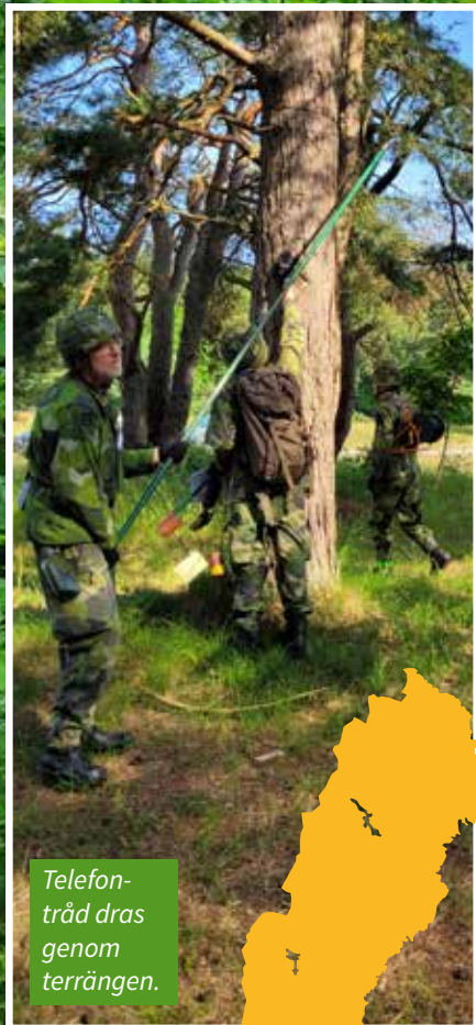
Telefontråd dras genom terrängen.