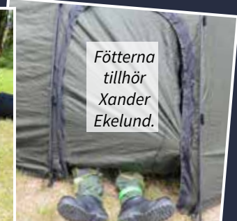
Fötterna tillhör Xander Ekelund.