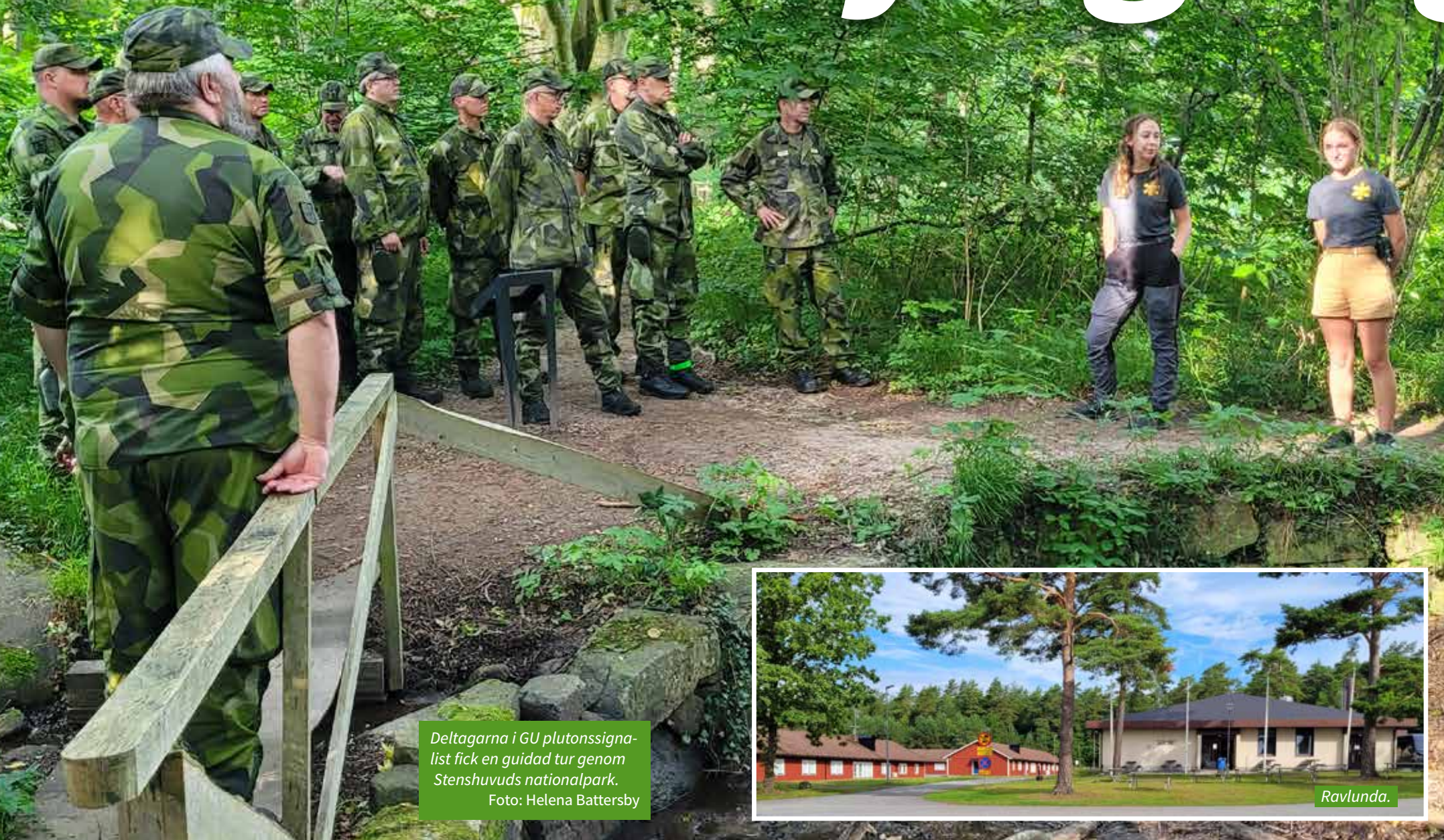
Deltagarna i GU plutonssignalist fick en guidad tur genom Stenshuvuds nationalpark.