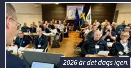
2026 är det dags igen.

Riksstämman är inte bara en plats för diskussioner och beslut, den är även ett tillfälle för nätverkande och att lära känna varandra. Centralstyrelsen och delegater vittnar också om en positiv stämning hela helgen och en känsla av att ”vi gör det här tillsammans”.